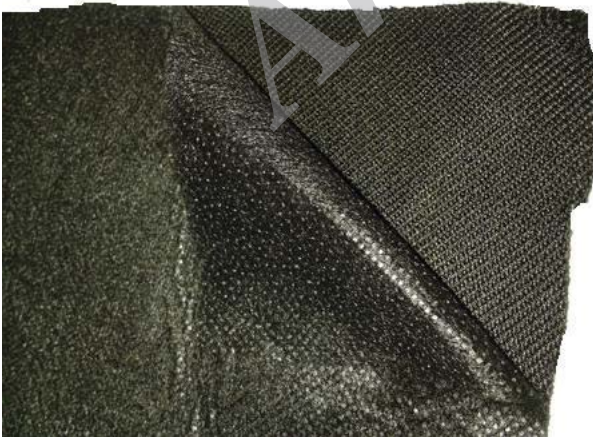
شکل ۲. پارچه کربنی لامینه شده توسط نایلون (پرلون)

پارچه کربن فعال شده خود از استحکام فیزیکی پایین برخوردار است. بنابراین ضروری بود که استحکام آن افزایش یابد تا قابلیت به‌کارگیری به عنوان فیلتر را داشته باشد. برای بالا بردن استحکام فیلتر پارچه کربنی، آستر (پرلون) با نفوذپذیری مناسب نسبت به هوا و وزن کم به طور یکنواخت در دو طرف پارچه کربنی با استفاده از چسب حرارتی شبکه‌ای (زانفیکس) پرس گرمایی ۱۵۰ درجه سانتی‌گراد در مدت ۵ دقیقه روکش شد (شکل (۲)). با توجه به اینکه پارچه آستری، از دو سطح، پارچه کربنی را روکش نموده است، ضمن افزایش استحکام فیزیکی، موجب افزایش مقاومت در برابر عوامل خارجی نیز می‌شود.