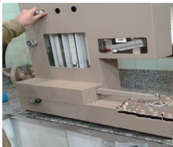
شکل ۳. دستگاه اندازه‌گیری نفوذ هوا از نمونه‌های کربن برای بررسی جذب شبه عامل به صورت بخار-بخار و مایع-بخار (با مجوز شرکت صنعتی میلاد)

قبل از انجام آزمایش نمونه به مدت ۲ ساعت در شرایط محیطی استاندارد قرار گرفتند تا نمونه‌ها رطوبت و دما محیط استاندارد برای آزمون را به‌دست آورند. دو نمونه به اندازه ۱۰۰ سانتی‌متر مربع از فوم آغشته شده به کربن فعال و پارچه کربنی آستر دار بریده شد و توسط دستگاه اندازه‌گیری نفوذ هوا (شکل ۳)، دبی عبوری از نمونه درافت فشار یک میلی بار اندازه‌گیری گردید. با توجه به سطح نمونه مورد آزمون، مقدار عبور هوا برحسب لیتر بر ثانیه به ازای یک مترمربع محاسبه شد [۳۱]. مقدار نفوذ هوا برای پارچه کربنی آستر دار ۱۰۸ و برای فوم پلی اورتان کربنی ۱۵۰ لیتر بر ثانیه به ازای هر مترمربع اندازه‌گیری شد که با توجه به مقدار نفوذ هوای مندرج در سند استاندارد دفاعی (کمینه ۱۰۰ لیتر بر ثانیه به ازای هر مترمربع پارچه) میزان نفوذ هوا برای هر دو نوع پارچه مورد قبول است.