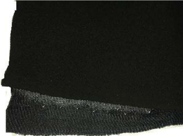
شکل ۱. فوم لامینه پلی اورتان آغشته شده به پودر کربن فعال

سلول باز به کربن فعال استفاده گردید. فوم پلی اورتان در هوای آزاد خشک و برای افزایش استحکام چسب آکرلیک، فوم به مدت ۱۰ دقیقه در دمای ۱۵۰ درجه سانتی‌گراد قرار گرفت. به منظور افزایش استحکام، لامینه شدن توسط فرایند اتصال شعله‌ای با آستر نایلون نفوذپذیر انجام شد (شکل (۱)).