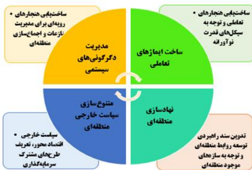
شکل ۳. کارویژه‌های سیاست خارجی کارآمد منطقه‌ای؛ طرحی برای ایران

جمعی برای توسعه روابط منطقه‌ای و شبکه‌سازی‌های جدید در جهت کارآمدسازی سیستمی - نهادی سیاست خارجی است. به‌طور مثال عربستان سعودی به‌تازگی با افتتاح دفتر چشم‌انداز سعودی - ژاپن ۱ در ریاض درصدد گسترش چارچوب‌های مشارکت فراگیر در منطقه بوده است (Rabi & Mueller, 2018, p.61-63). بر همین اساس ایران هم باید با تعریف طرح‌های مشارکتی در چارچوب مشارکت فراگیر منطقه‌ای با بازیگران منطقه‌ای که در آینده‌ای نزدیک از قطب‌های مهم توسعه‌یافتگی خواهند بود از جمله قطر در منطقه خلیج فارس و ترکیه در خاورمیانه و تعریف طرح‌هایی با کشورهای شرق آسیا از جمله سنگاپور، تایوان و اندونزی، خواهد توانست بر میزان کنشگری و کارآمدی سیاست خارجی بیفزاید.