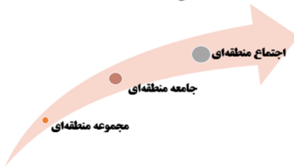
شکل ۲. مسیر گذار از محیط تقابلی به بستر تعامل محورانه منطقه‌ای

و به نوعی منجر به کارآمدسازی سیاست خارجی دولت‌های درگیر در این پروسه می‌شود و می‌تواند در قدرت‌کنشگری بین‌المللی آنان هم مؤثر باشد.