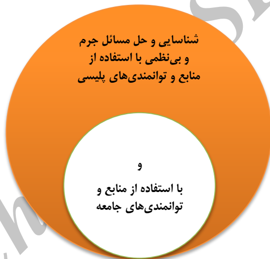
شکل شماره (۲): وابستگی رویکرد مسئله محوری (دایره بزرگ) به پلیس جامعه محور (دایره کوچک)

پلیس مسئله محور با روش اجرایی خاص خود می تواند کمک بسیاری به پلیس جامعه محور کند؛ از این رو، مسئله محوری بخشی از رویکرد پلیس جامعه محور به شمار می آید. بنابراین مسئله محوری را به صورت دایره کوچک در دل رویکرد پلیس جامعه محور قرار داده ایم. تأثیر رویکرد مسئله محوری بر عملکرد پلیس جامعه محور تا جایی است که در تحقیقی نشان داده شد که پلیس جامعه محور، بدون رویکرد مسئله محوری، بر جرم و بی نظمی تأثیر گذار نیست؛ اگرچه می تواند بر سطح ترس شهروندان و همچنین احتمال کاهش تخلف — به دلیل ارتقای مشروعیت پلیس — تأثیر گذار باشد (ویزبرد و ایک، ترجمه کریمی خوزانی، ۱۳۸۸).