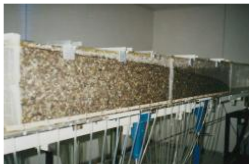
شکل ۴: تصویری از آزمایش روی نمونه S_{IR} با بیشترین دبی ممکن.

مختلف انجام شده و در هر آزمایش علاوه بر ثبت دبی و دمای آب، مقادیر بلندای پیژومتریک و ارتفاع آب در فاصله‌های مختلف، ثبت شده‌اند. در ادامه مقادیر گرادیان هیدرولیکی i و سرعت ظاهری V در مقاطع مختلف، محاسبه شده و سپس با استفاده از تحلیل‌های آماری، مقادیر a و b رابطه دوجمله‌ای به دست آمده‌اند. با توجه به رابطه‌های (۹)، (۱۰) و (۱۱)، مقادیر ضرایب نفوذپذیری c و d محاسبه شده‌اند. نتایج محاسبات آماری در جدول (۲) مشخص شده است.