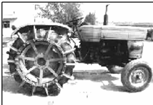
شکل ۲- چرخ آهنی باغی در حالت درگیر با زمین

این نوع چرخ دارای یک شاسی بوده که بر روی رینگ چرخ‌های عقب تراکتور نصب شده و شامل تعداد ۱۴ عدد پره آهنی به ارتفاع ۶ سانتی‌متر می‌باشد که جهت امکان حرکت به‌صورت حمل و نقل در جاده، قابلیت باز و بسته شدن به‌صورت لولایی بر روی لاستیک چرخ را دارد (شکل‌های ۱ و ۲). مجموع وزن شاسی و پره‌ها در دو طرف حدود ۱۵۰ کیلوگرم می‌باشد. از این نوع چرخ آهنی برای اجرای عملیات خاک ورزی اولیه و ثانویه و کودپاشی اولیه در اوایل بهار که زمین معمولاً کاملاً خیس بوده و به علت لغزش چرخ‌های لاستیکی اجرای عملیات مقدور نیست، استفاده می‌شود.