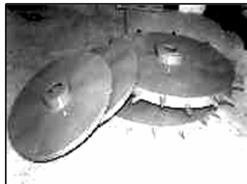
شکل ۳- چرخ‌های آهنی باتلاقی جلو و عقب تراکتور

که امکان ماله‌زدن با چرخ‌های لاستیکی وجود نداشت، تنها سرعت پیش روی تراکتور و ظرفیت مزرعه‌ای مؤثر عملیات تسطیح با ماله به هنگام استفاده از چرخ‌های باتلاقی در شرایط عمق کار ۲۰ سانتی‌متر