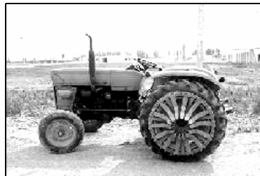
شکل ۱- چرخ آهنی باغی در حالت حمل و نقل

این تحقیق برای ارزیابی دو نوع چرخ آهنی تراکتور در عملیات تهیه زمین برنج به منظور افزایش بازده کششی تراکتور انجام گرفت.