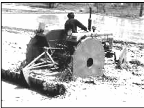
شکل ۴- عملیات ماله‌زنی با چرخ آهنی

در ارزیابی چرخ‌های آهنی باتلاقی، با توجه به این