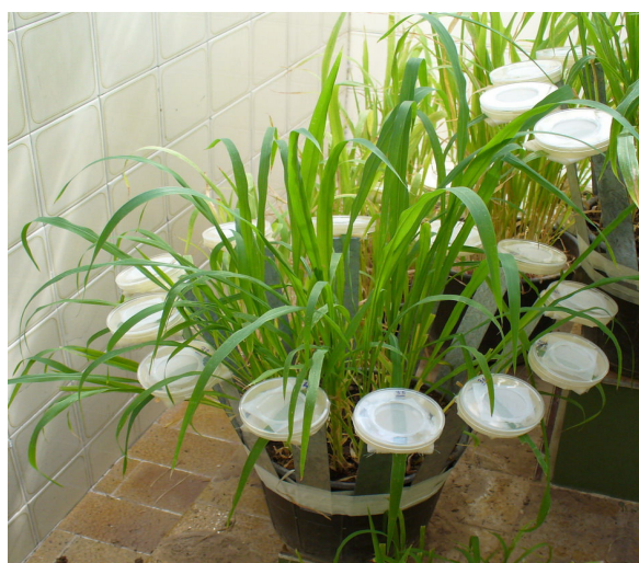
شکل ۱- قفس‌های برگ مورد استفاده در آزمایش زیست‌سنجی

متوات و متاسیستوکس روی شته Lipaphis erysimi بسیار بیشتر از حشره‌کش تماسی مالاتیون بوده است. تقی‌زاده (۱۳۷۵) در بررسی تأثیر چند حشره‌کش روی شته سبز هلو در روی درختان بادام، هلو و بوته‌های فلفل به این نتیجه رسید که پیریمیکارب بهترین شته‌کش مصرفی در تمام مناطق و روی کلیه گیاهان میزبان مورد آزمایش بوده و مالاتیون اثر کنترل‌کنندگی کمتری روی شته سبز هلو در مناطق مورد آزمایش داشت. هم‌چنین مو ۱ و همکاران (۱۹۸۴) مقدار LC50 پیریمیکارب را روی شته سبز هلو ۶/۹ ppm به دست آورده و استفاده از این حشره‌کش در مزرعه ۸۵ درصد جمعیت شته را در مزارع توتون کاهش داد. با این وجود سانگ سئونگ ۲ و همکاران (۱۹۹۳) مقاومت شته سبز سیب را به این حشره‌کش گزارش و LC50 آن را ۱۷۴۵ ppm به دست آورده‌اند. بر اساس نتایج تحقیقات درویش مجنی (۱۳۸۴) ایمیداکلوپراید و متاسیستوکس شرکت بایر آلمان به ترتیب با ۸۸/۷۴ و ۷۸/۱۰ درصد تلفات بیشترین تأثیر را روی شته پنبه، Aphis gossypii داشتند و این در حالی است که درصد تأثیر فرمولاسیون ایرانی دو حشره‌کش مذکور به ترتیب ۲۹/۵۲ و ۴۰ درصد بوده است. نمودار ۱ شاخص پتانسیل نسبی کاهش غلظت حشره‌کش‌های مورد آزمایش را نشان می‌دهد. این شاخص از نسبت غلظت مورد استفاده حشره‌کش در مزرعه به LC50 آن