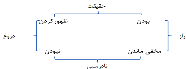
مدل ۳: مربع حقیقت‌نمایی

مربع حقیقت‌نمایی به‌منزله گونه‌ای از مربع معناشناسی، ابزاری مناسب برای تحلیل این داستان است. در داستان «مردی در قفس» مفاهیم ظهور، حقیقت و یا دروغ معانی خاصی به خود می‌گیرند که در طول داستان اثرگذار می‌شوند. سید حسن خان از زمان مرگ سودابه، خود را در خانه پدری‌اش مخفی کرده است و هیچ‌کس او را نمی‌بیند. همین امر باعث می‌شود حقیقت زندگی او در تقابل با آنچه دیگران درباره‌اش خیال‌بافی می‌کنند، در تعارض قرار گیرد.