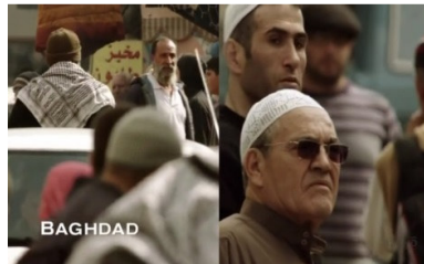
تصویر ۲: فصل اول، قسمت اول Picture2. Season 1, Episode 1