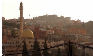
تصویر ۱: فصل اول، قسمت اول Picture1. Season 1, Episode 1