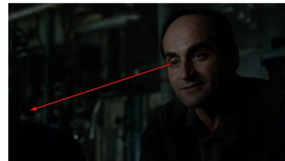
تصویر ۱۱: فصل دوم، قسمت دهم Picture11. Season 2, Episode 10