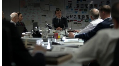
تصویر ۱۴: فصل پنجم، قسمت اول Picture14. Season 5, Episode 1