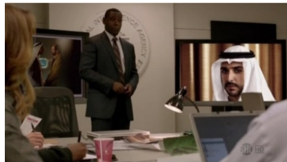
تصویر ۱۰: فصل اول، قسمت سوم Picture10. Season 1, Episode 3