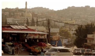
تصویر ۳: فصل اول، قسمت اول Picture3. Season 1, Episode 1