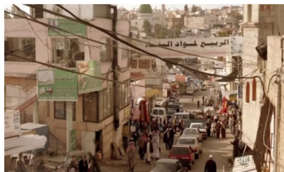
تصویر ۶: فصل اول، قسمت اول Picture6. Season 1, Episode 1