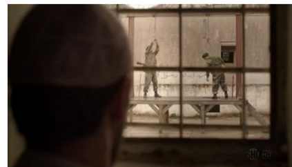
تصویر ۵: فصل اول، قسمت اول Picture5. Season 1, Episode 1