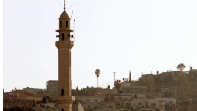
تصویر ۸: فصل اول، قسمت اول Picture8. Season 1, Episode 1