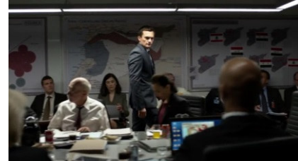
تصویر ۱۳: فصل پنجم، قسمت اول Picture13. Season 5, Episode 1