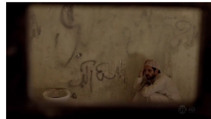
تصویر ۹: فصل اول، قسمت اول Picture9. Season 1, Episode 1