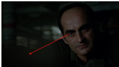
تصویر ۱۲: فصل دوم، قسمت دهم Picture12. Season 2, Episode 10