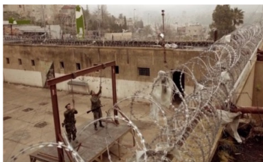
تصویر ۴: فصل اول، قسمت اول Picture4. Season 1, Episode 1