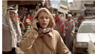
تصویر ۷: فصل اول، قسمت اول Picture7. Season 1, Episode 1