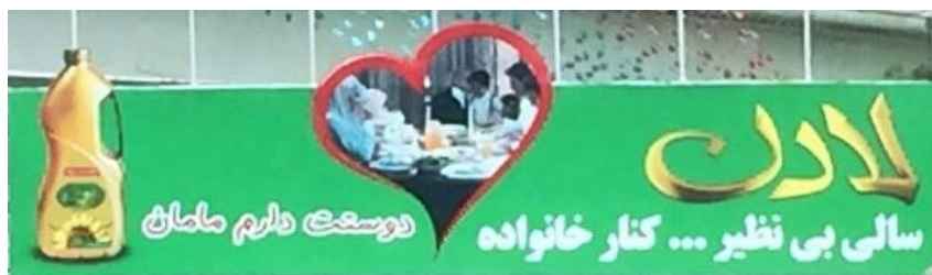
نمونه ۱: روغن مایع گیاهی لادن