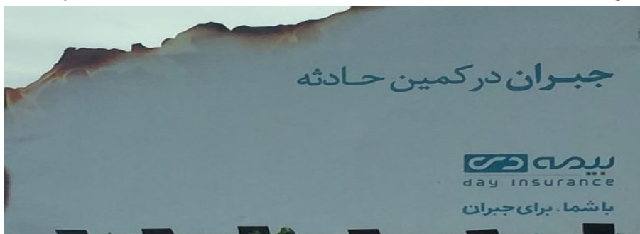
نمونه ۵: بیمه دی