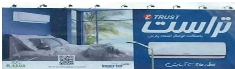
نمونه ۴: کولرهای گازی تراست

گفتمان‌سازی تصویر نظام اتصال ایجاد کرده است. در این تصویر که متن دیداری تلقی می‌شود شرایط حسی - ادراکی تعیین‌کننده رابطه میان مخاطب با متن دیداری است و بر اساس همین رابطه معنا کنونیت می‌یابد. به عبارت دیگر، این معنا همان معنای در حال «شدن» است که در رابطه حسی - ادراکی بین بیننده و متن (مشخصاً تصویر) شکل می‌گیرد. تصویری سیال که بر اساس تولید رابطه عاطفی به صورت شوشی قابل تبیین است.