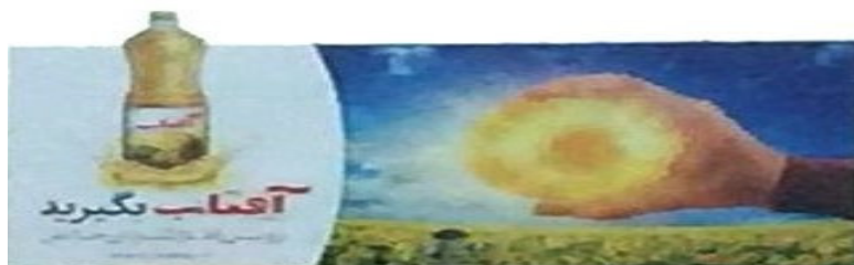
نمونه ۲: روغن مایع گیاهی آفتاب

کمک زبان و بافت انتقال می‌یابد. آغازگر بند «سالی بی‌نظیر» است که اطلاع نو محسوب شده و در سمت راست تصویر آمده است؛ یعنی تأکید به داشتن سالی بی‌نظیر به سبب مصرف سالانه و مداوم این کالای با کیفیت «کنار خانواده» (همراه با عکس خانواده) و یا بند «دوستت دارم مامان» تأکید به دوست داشتن (همراه با عکس قلب) که اطلاع کهنه محسوب شده می‌شوند و در سمت چپ آن قرار دارند. گفتنی است راست و چپ هر تصویر با توجه به راست و چپ بیننده آن تصویر مشخص می‌شود. به همین سبب در فرهنگ ما با توجه به شکل نوشتار راست به چپ اهمیت دارد و اطلاعات نو و کهنه این بیلورد نیز در این ارتباط شکل گرفته‌اند. با استناد به سازوکارهای نظری موجود در نقش‌گرایی، بازنمایی فرانش متنی در این تبلیغ بدین صورت است که تصویر و شکل ظاهری بیلورد با متن، محتوا و آنچه در آن مرقوم شده است، به‌گونه‌ای واحد از طریق بازتولید متنی منسجم و دارای پیوستگی لازم، هر دو در یک راستا در پیشبرد و بیان معنا کوشیده‌اند.