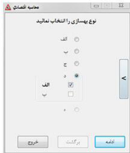
شکل ۱: نحوه انتخاب نوع راه