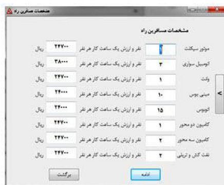
شکل ۲: صفحه ورود اطلاعات مربوط به مسافرین راه

پس از وارد نمودن اطلاعات در تمامی صفحات و تأیید داده ها توسط کاربر، نرم افزار اطلاعات را تحلیل و خروجی را در قالب فایل میکروسافت