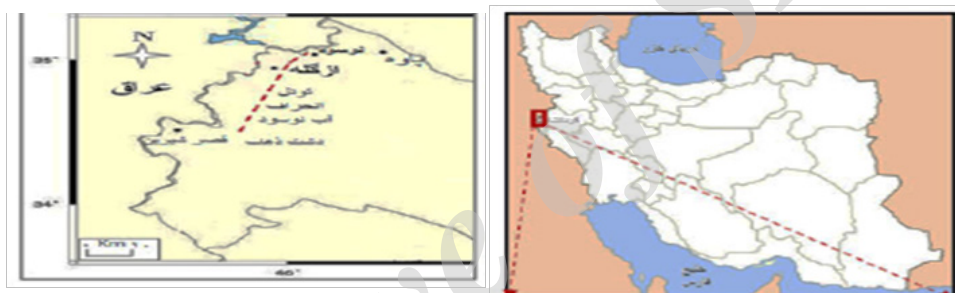
شکل ۲: موقعیت جغرافیایی و راه‌های دسترسی تونل زاگرس ۱ در استان کرمانشاه [۱۳]

تونل انتقال آب نوسود بخشی از طرح انتقال آب به دشت‌های گرمسیری غرب کشور است که آب منحرف شده از رودخانه سیروان را به پایین دست منتقل کرده و هدف از احداث این تونل، کنترل و تنظیم آب‌های سطحی منطقه وسیعی از غرب کشور و انتقال آن به دشت‌های زراعی منطقه می‌باشد. قطعه یک تونل نوسود (تونل زاگرس ۱) از حوالی روستای هیروی تا ازگله ادامه دارد. قطعه اول این تونل (حد فاصل مره خیل تا هیروی) به طول حدود ۱۴ کیلومتر با عنوان قطعه یک- الف اجرا خواهد شد. مقطع تونل به صورت دایره‌ای و با قطر تمام شده ۴/۵ متر و شیب ۰/۰۰۱۰۸۳/ برای انتقال آب به صورت ثقلی طراحی شده است. اجرای تونل (حفاری و سگمنت‌گذاری) به صورت مکانیزه و با استفاده از دستگاه تی بی ام انجام می‌گیرد. همچنین شروع حفاری تونل به صورت شیب مثبت و از طرف دهانه مره خیل می‌باشد. در شکل ۲ موقعیت جغرافیایی و راه‌های دسترسی به تونل زاگرس ۱ نشان داده شده است.