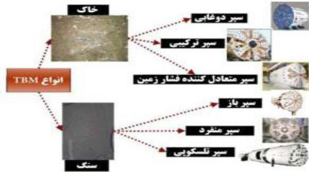
شکل ۱: انواع ماشین‌های حفر تونل [۲]

هدف از اجرا و انجام این تحقیق، ارائه روابط مناسب برای پیش‌بینی نرخ نفوذ ماشین در هنگام حفاری تونل با ماشین حفاری تی بی ام سیر تلسکوپی و مقایسه آن با سایر مدل‌ها می‌باشد.