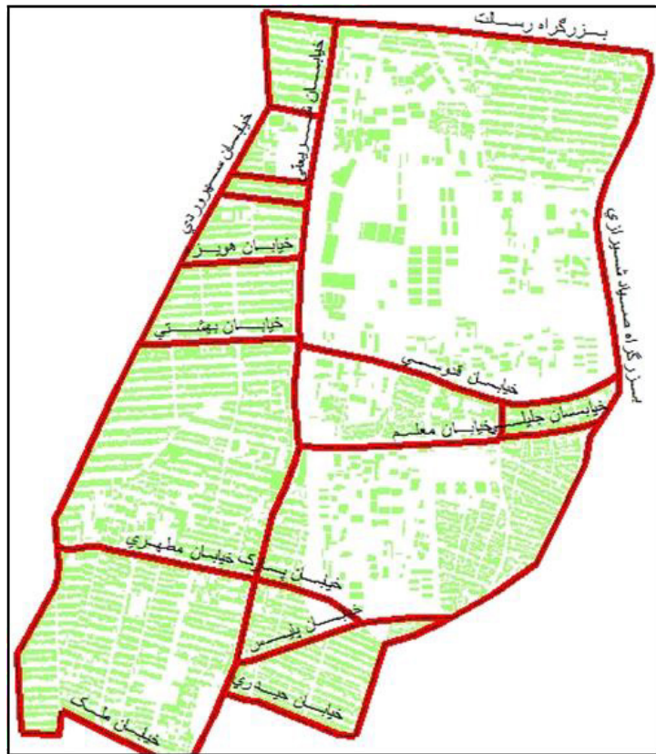
شکل ۲. منطقه مورد مطالعه Fig. 2. Area of study

آنچه در این تحقیق برای جمعیت بلوک های غیر مسکونی فرض شده است این است که برای مثال جمعیت هر بلوک اداری برابر است با کل جمعیتی که به طور میانگین طی یک روز اداری فعال در آن اداره سکونت دارند. جمعیت هر بلوک مسکونی با توجه به آمار نفوس و مسکن بدست می آید و برای هر بلوک مسکونی منظور می گردد. از آنجایی که این محدوده شامل بلوک های زیادی می باشد تنها بخشی از جدول جمعیتی بلوک ها را در جدول ۱ آمده است.