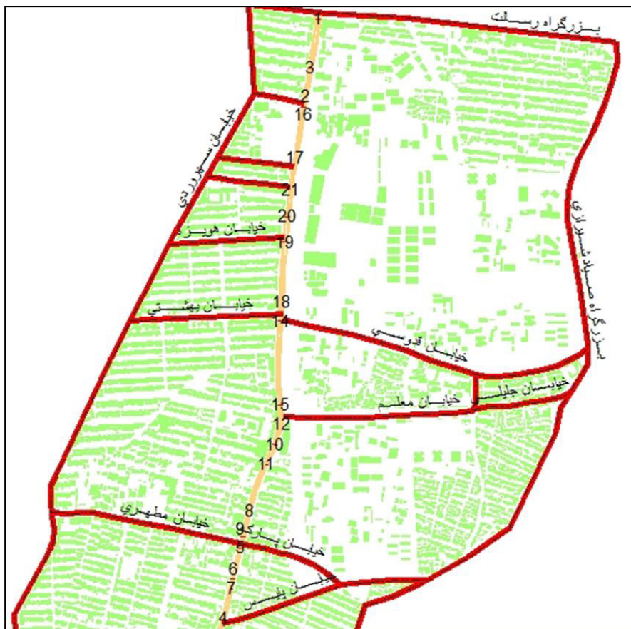
شکل ۵. اولویت بندی احداث گذرگاه غیر همسطح عابر از ۱ تا ۲۱