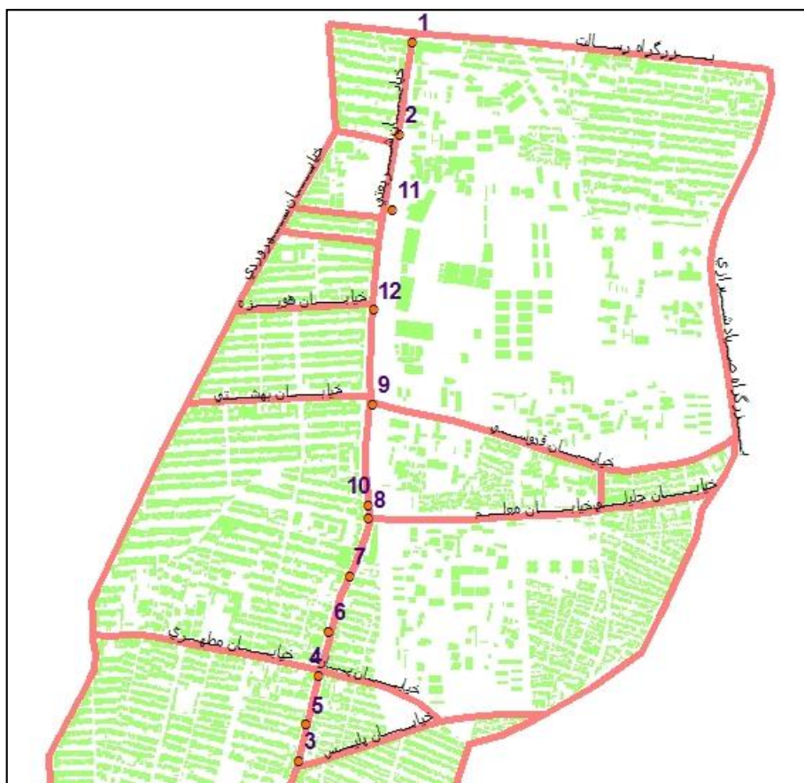
شکل ۶. اولویت بندی احداث گذرگاه غیر همسطح عابر مکان یابی شده