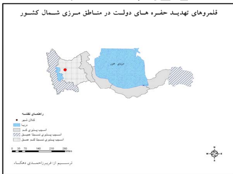
نقشه ۱: حفره‌های دولت در شمال کشور

بنابراین استان‌های آذربایجان غربی و خراسان دارای حفره‌هایی نسبتاً عمیق هستند و استان آذربایجان شرقی دارای حفره‌هایی نسبتاً کم عمق و سایر استان‌ها حفره‌هایی عمق کمی دارند. نقشه زیر این وضعیت را به خوبی در استان‌های مرزی شمال کشور نشان می‌دهد.