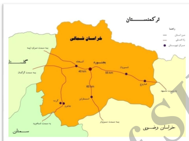
شکل (۱) نقشه استان خراسان شمالی و موقعیت شهر بجنورد در آن مأخذ: نگارنده بر پایه اطلاعات پورتال استانداری خراسان شمالی در سال ۱۳۹۱

مسکونی قدیم شهر به طور عمدۀ بدون برنامه‌ریزی ایجاد شده و دارای معابر پر پیچ و خم و باریک هستند.