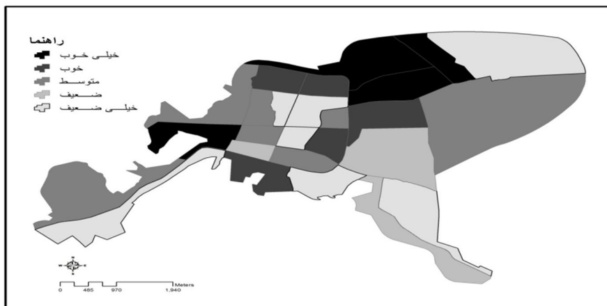
نقشه شماره ۳-رتبه بندی محلات شهر مراغه براساس شاخص های کیفیت زندگی با استفاده از طیف رنگی بازسازی: نگارندگان، ۱۳۸۹