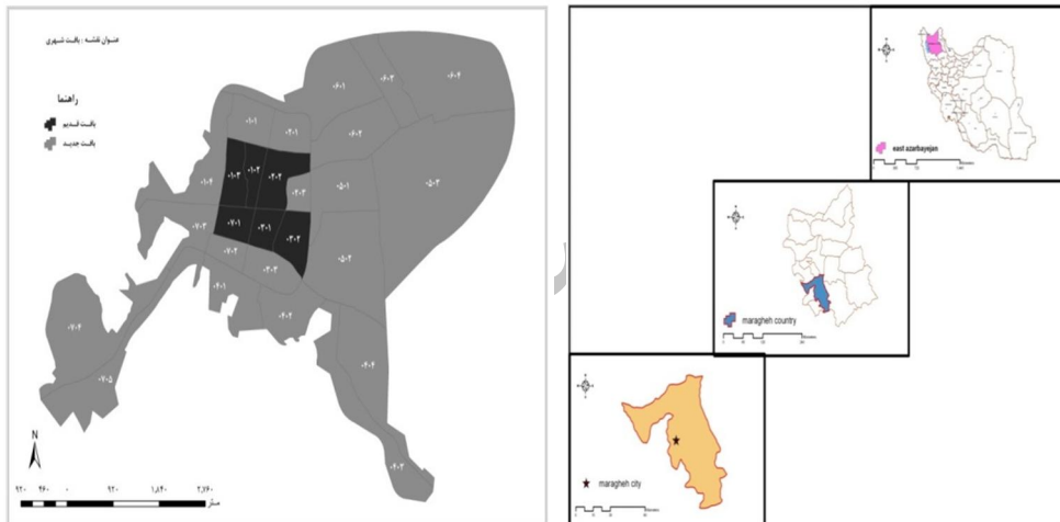
نقشه ۲- موقعیت محلات بافت قدیم و جدید شهر مراغه

شهر مراغه یکی از قدیمی ترین شهرهای ایران است. این شهر در زمان استیلای مغول توسط هلاکو خان به عنوان پایتخت کشور ایران انتخاب شد. این شهر در ۳۷ درجه و ۲۳ دقیقه عرض شمالی و ۴۶ درجه و ۱۶ دقیقه طول شرقی واقع شده است و ارتفاع آن از سطح دریا ۱۳۹۰ متر می باشد. شهر مراغه به وسعت تقریبی ۲۶۴۷ هکتار در امتداد رودخانه‌ی صوفی چای و در دامنه های جنوبی کوه سهند واقع شده است. جمعیت شهر طبق سرشماری سال ۱۳۸۵، معادل ۱۴۹۹۲۹ هزار نفر بوده است. ۲۹۸۰۹ نفر که تقریباً ۲۰ درصد جمعیت شهر مراغه را شامل می شود، در بافت قدیم یا تاریخی این شهر زندگی می کنند، این شهر به لحاظ ساختاری تقریباً شطرنجی است و بافت قدیمی دارای بافتی تقریباً ارگانیک می باشد. هم اکنون شهر مراغه دارای ۲۶ محله و ۷ ناحیه می باشد.