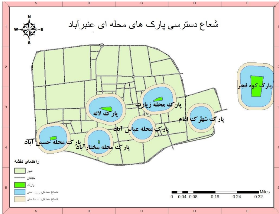
نقشه ۲- توزیع پارک‌ها در سطح شهر عنبرآباد و تعیین شعاع دسترسی آن

بررسی توزیع و ترسیم شعاع دسترسی پارک‌ها نشان داد شهروندان ساکن در بعضی محلات شهر عنبرآباد نمی‌توانند مطابق اصول و استانداردهای تعیین شده به پارک‌ها دسترسی داشته باشند. شهرک نارنج، و محله خدآفرین ۱ و ۲ از جمله این جمله‌اند.