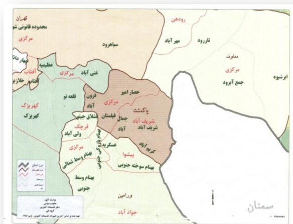
نقشه (۱): موقعیت نسبی شهرستان پاکدشت