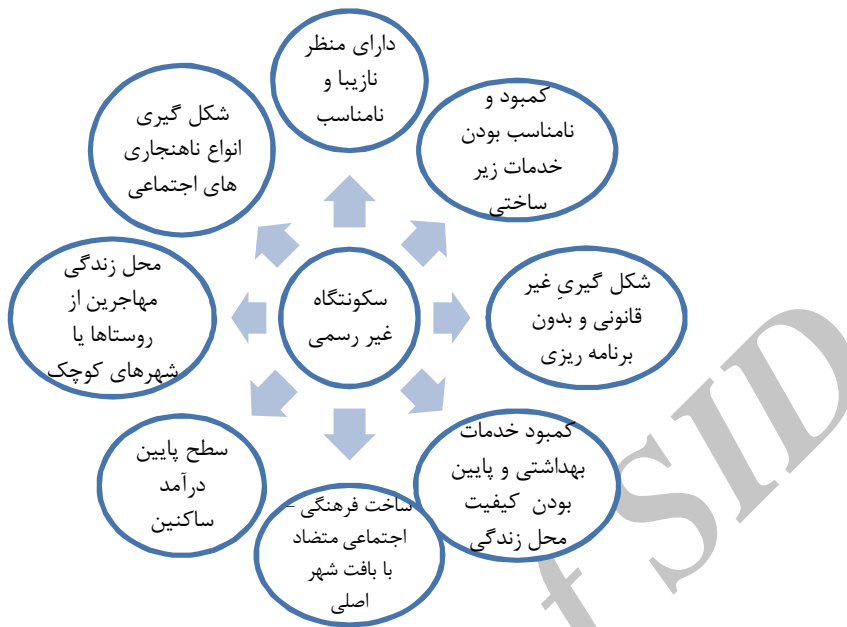
شکل شماره ۱: مشخصات و ویژگی های سکونتگاه های غیر رسمی