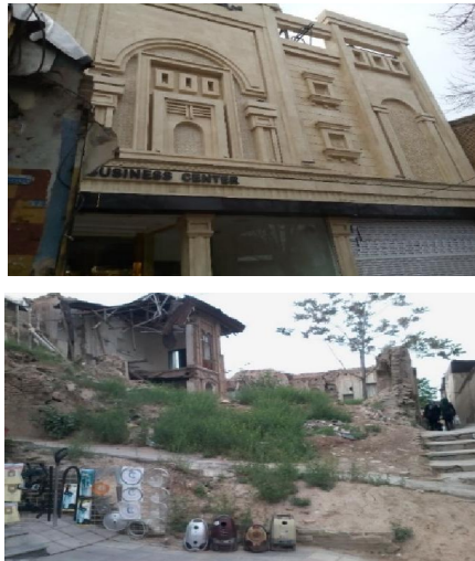
تصویر ۱. دوگانگی بافت‌های فرسوده و نوساز بافت

مرکزی به کندی پیش رود. و همین موضوع خود باعث فرسودگی و دوگانگی بیشتری شود (تصویر ۱).