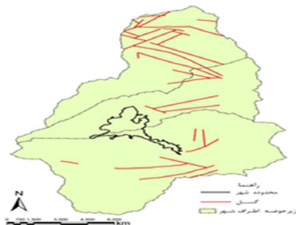
شکل ۳- زمین‌شناسی و گسل‌های حومه شهر تویسرکان

سه گسل اصلی با امتداد شمالی و جنوبی در جنوب شهر همدان در شرق کوه الوند وجود دارند. مهم‌ترین و طولانی‌ترین آنها (تقریباً به طول ۳۵ کیلومتر) از جنوب شهر همدان شروع می‌شود، به طرف جنوب تا کوه سنگ سفید در شرق شهر تویسرکان ادامه می‌یابد، سپس به گسل‌های فرعی کوه چشم دره در جنوب شهر تویسرکان می‌پیوندد. این گسل به نام کشین- علی آباد دمق معروف است.