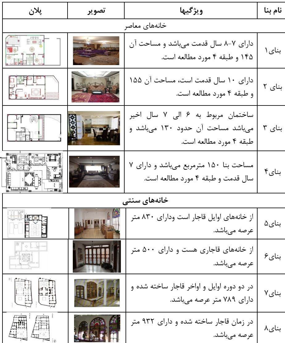
جدول شماره (۱): مشخصات بناهای مورد مطالعه