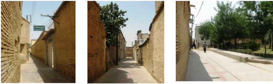
تصویر ۱: کیفیت‌های فضایی گذر اکباتان