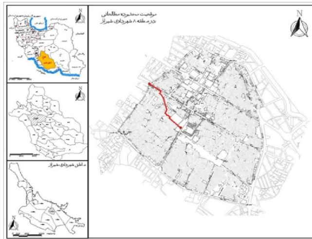
تصویر ۲: موقعیت گذر کوچه اتابکان در منطقه ۸