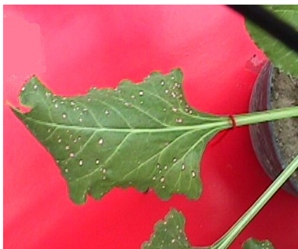
شکل ۱- تنوع مورفولوژیکی جدایه های C. beticola روی محیط کشت V8A (A) و علائم بیماری روی برگ (B)