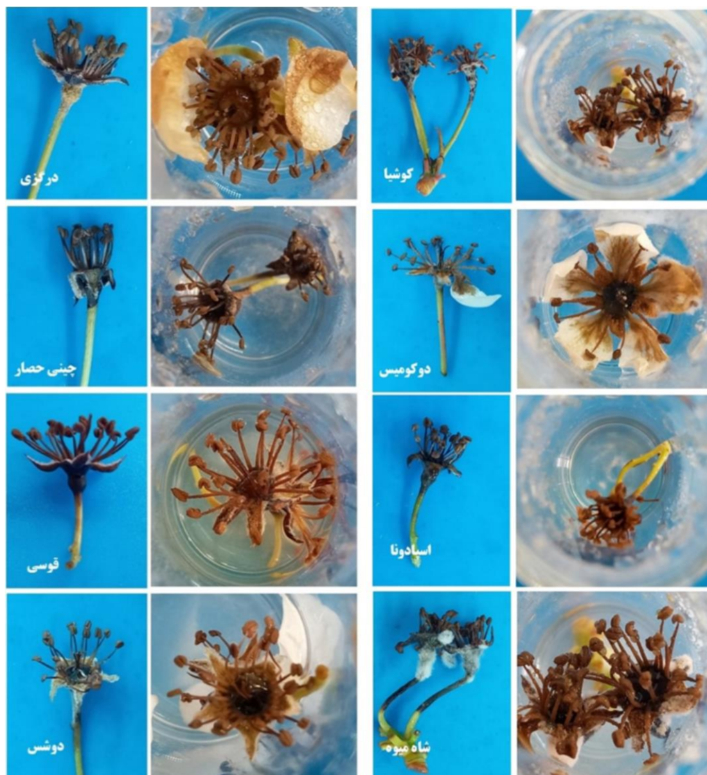
شکل ۳- آزمون بیماری زایی در بافت شکوفه بر روی هشت رقم مختلف گلایی