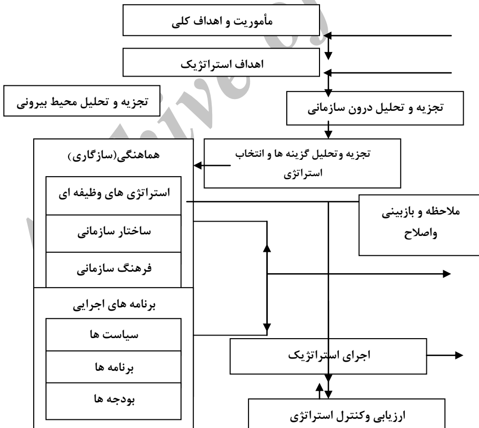
نمودار ۱. مراحل مدیریت استراتژیک