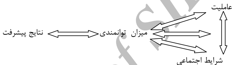
شکل ۱: میزان توانمندی

تصمیماتش را به فعالیت‌ها و نتایج دلخواه انتقال می‌دهد. تیم توانمندسازی بانک جهانی اظهار کرده است که میزان توانمندسازی قابل اندازه‌گیری است. شکل ۱ نشان می‌دهد که توانایی تصمیم‌گیری مؤثر ابتدا تحت تأثیر دو عامل قرار می‌گیرد: عاملیت ۱ و شرایط اجتماعی ۲ . عاملیت، توانایی کنشگر برای گرفتن تصمیمات با معنادار تعریف شده است؛ به این معنی که کنشگر برای مواجهه با گزینه‌های مختلف و گرفتن تصمیم، توانمند است. شرایط اجتماعی، زمینه‌های رسمی و غیررسمی که کنشگر در آن فعالیت می‌کند تعریف شده است. این عوامل وقتی با هم به کار بیفتند، میزان توانمندسازی را افزایش می‌دهند (السوپ و هینسون ۳ ، ۲۰۰۵: ۶).