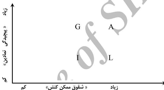
نمودار ۲: جایگاه نظام‌های کنش در فضای کنش

جایگاه هر یک از نظام‌های فوق در دستگاه مختصات دو بعدی قابل شناسایی است: