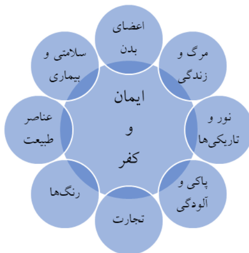
۱. حوزه‌های مبدأ ایمان و کفر در قرآن کریم