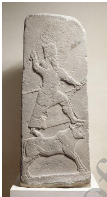
تصویر ۶) عداد، ایزد بابلوی توفان، در سنگ‌نگاره‌های متعلق به سده ۸ پ. م.

گذشته از آن، در روایت‌ها و داستان‌های کُردی نیز به یادمان پیروزی فریدونِ گاوسوار، جشنی برپا می‌کنند. در روز نوروز مردم سلیمانیه شهر را ترک می‌کنند و در جشن‌گاه گرد می‌آیند، شاهی را بر تخت می‌نشانند و درباریان و محافظان را تعیین می‌کنند. شاه سوار بر گاو، درحالی‌که درباریان از پی او روان هستند در میان جماعت به اردوگاه می‌آید، چادر می‌زنند، دیوان برپا می‌کنند و دیگ غذا را بار می‌گذارند. عده‌ای که پوست بز و گوسفند پوشیده‌اند در تمام مدت جشن که سه روز بدرازا می‌انجامد، نقش دام‌های خانگی را بازی می‌کنند. مردم بی‌هیچ اعتراضی از پادشاه فرمان می‌برند. شاه بر مردم مالیات می‌بندد؛ خواه در این گردهمایی باشند یا نباشند. این شخص تا جشن دیگر هم‌چنان عنوان پادشاهی را حفظ می‌کند. این جشن در حقیقت یادگارِ شورش فریدون علیه ضحاکِ ماردوشِ ستم‌گر است. کردها می‌گویند فریدون سوار بر گاو نیروهای خود را در جنگ با ضحاک رهبری کرد (وهبی، ۱۳۸۴: ۱). در سرودی گورانی از شاه تیمور بانیارانی (سده ۱۳ هـ ق) از فریدون گاوسوار در کنار تهمت‌ن رخس‌سوار یاد شده است (صفی‌زاده، ۱۳۶۱: ۱۷۹) [۴]. هم‌چنین آنان معتقدند که نام کاوه از واژه گاو گرفته شده است (لطفی‌نیا، ۱۳۸۸: ۸۹-۹۰).