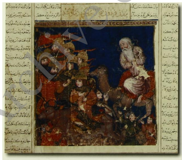
تصویر ۳) نگاره شاهنامه بزرگ ایلخانی با نقش فریدون گاوسوار، سده ۸ هـ.ق.

در شاهنامه بزرگ ایلخانی (دموت، حدود ۷۲۰-۷۵۰ هـ.ق) فراهم آمده در تبریز، شاهنامه ابراهیم سلطان (۸۱۶ هـ.ق) در شیراز و هم‌چنین در گرشاسپ‌نامه متعلق به سال ۹۸۱ هـ.ق در قزوین فریدون سوار بر گاوی کوهان دار است (Abdullaeva-Melville, 2008: 66-67):