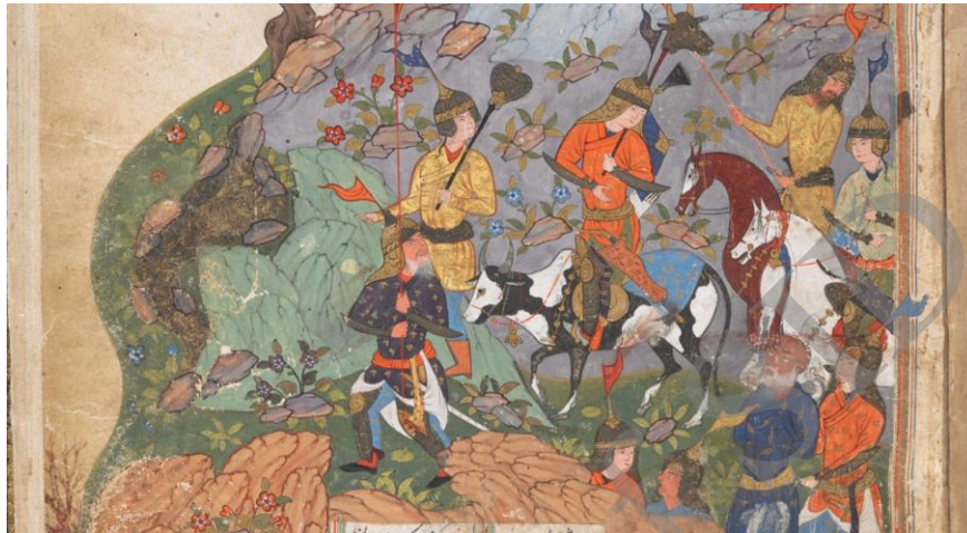
تصویر ۵) نگاره گرشاسپ‌نامه ۸۹۱ هـ ق با نقش فریدون گاوسوار.

دو نگاره مهم شاهنامه در تبریز و شیراز و همچنین نگاره گرشاسپ‌نامه در قزوین بیان‌گر آن است که نگارگران این سه مکتب از داستان گاوسواری فریدون در غرب ایران آگاه بوده و بر پایه سنت حماسی، سینه‌به‌سینه و نگارگری روایی، آن را وارد متن شاهنامه فردوسی و گرشاسپ‌نامه اسدی توسی کرده‌اند؛ با آن‌که در شاهنامه و گرشاسپ‌نامه هیچ اشاره‌ای به گاوسواری فریدون وجود ندارد. پی‌گیری پیشینه این سنت حماسی و نگارگری، ما را به سنگ‌نگاره‌های بابلی رهنمون می‌سازد. عداد، ۱ ایزد بابلی توفان، در سنگ‌نگاره‌ای متعلق به سده ۸ پ. م. در حالی ایستاده بر گاو نر تصویر شده است؛ در حالی که گریزی از تندر در دست دارد (زیران ۲ - دلاپورت، ۳ ۱۳۷۵: ۱۲۲). این سنگ‌نگاره می‌تواند کهن‌ترین پیش‌نمونه تصاویرهای گاوسواری فریدون باشد: