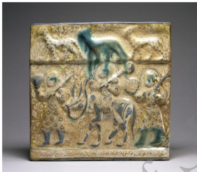
تصویر (۱) کاشی با نقش فریدون گاوسوار، سده ۷ هـ.ق.

بر روی تاسی متعلق به سال ۷۵۲ هـ.ق (احتمالاً تولیدشده در فارس) نیز فریدون در پیکر سواری ریش‌دار، درحالی‌که تاجی بر سر و گرزگی گاوسر بر دست دارد، سوار بر گاوی کوهان‌دار تصویر شده است. ضحاک نیز با دستان بسته، بالاتنه عربان و سر برهنه درحالی‌که سر دو مار از شانه‌های وی بیرون زده، پشت سر فریدون است (برند، ۱۳۸۸: ۱۷۹، ۱۸۶):