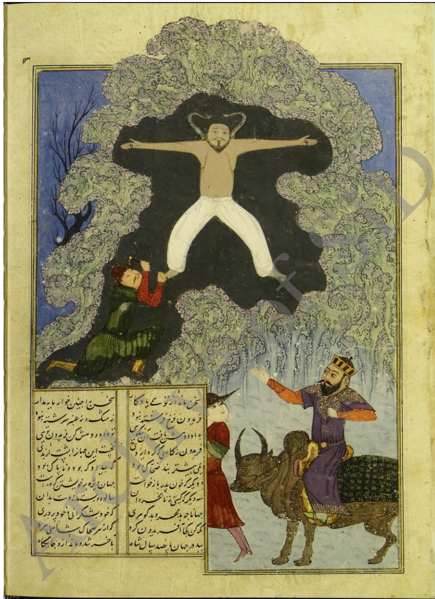
تصویر ۴) نگاره شاهنامه ابراهیم سلطان با نقش فریدون گاو سوار، سده ۹ هـ.ق.