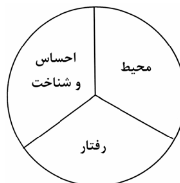
شکل ۱: چرخه تحلیل مصرف کننده (Peter, 2004)