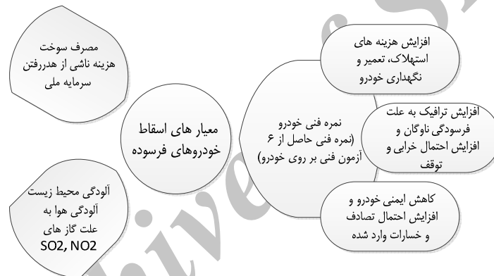
شکل ۱. معیارها و زیرمعیارهای اسقاط خودروهای سواری فرسوده

دیگرام طراحی شده در شکل ۱، نحوه دسته‌بندی معیارها و زیرمعیارهای اسقاط خودروی سواری را به تصویر می‌کشد.