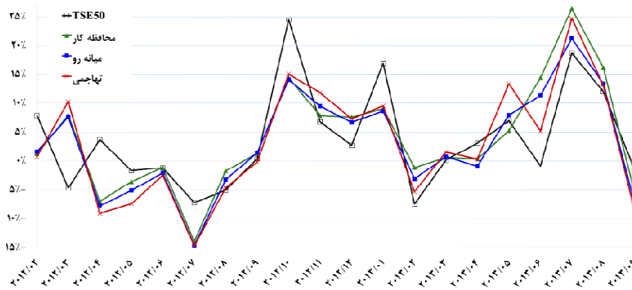
شکل ۱. بازده ماهانه