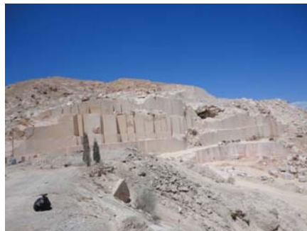
شکل ۱: سینه‌کار اصلی معدن مرمیت برد شیراز