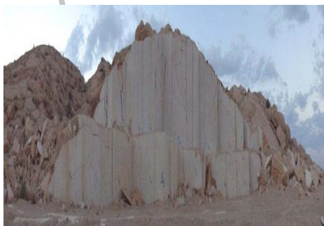
شکل ۲: نمای گسترده سینه‌کار صورتی (معدن شرقی)

بهره‌بردار معدن جدیداً بدلیل دستیابی به سنگ مطلوبتر با شکستگی کمتر و رنگ بهتر نسبت به باز نمودن یک سینه‌کار جدید در فاصله کمتر از یک کیلومتری غرب سینه‌کار اصلی اقدام نموده‌است. در این سینه‌کار که به‌نام معدن سنگ صورتی شناخته می‌شود هنوز عملیاتی زیادی صورت نگرفته‌است. روند کلی سینه‌کار (جهت پله‌های استخراجی) روندی شرقی- غربی می‌باشد. طبق اندازه‌گیری‌های دقیقی که توسط کمپاس و نیز توسط محاسبات کامپیوتری در نرم‌افزار Map Source 6.12.4 صورت گرفته است، امتداد کلی پله ۱ (طبقه پایین) ۹۳/۷ درجه، پله ۲ (وسط) ۸۷/۳ درجه و پله بالایی نیز ۸۷/۳ درجه بدست آمده‌است. روند کلی سینه‌کار با توجه به شکل تقریباً نیم دایره‌ای آن ۸۹/۴ درجه می‌باشد. در شکل ۲ نمای کلی سینه‌کار شماره دو مشاهده می‌شود.