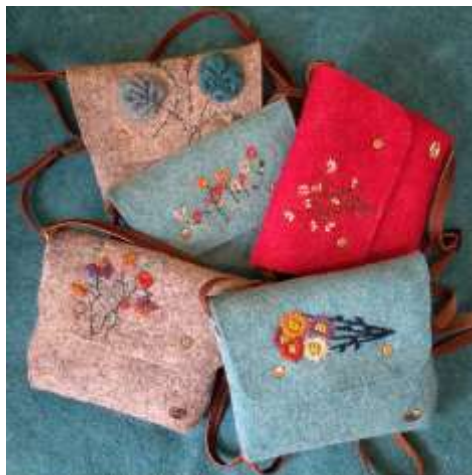
تصویر (۵) صنایع دستی مدرن تولیدشده توسط برندها (به‌ترتیب از راست به چپ برند موگه، برند فام، برند دستا و برند کلوزار)