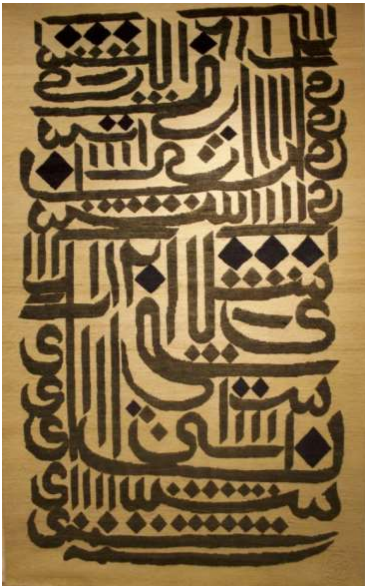
عکس (۴) اثر برگزیده جشنواره صنایع دستی و هنرهای سنتی فجر ۱۳۹۵: میرمولا ثریا خالق برند "میرمولا ثریا" (در بخش نگاه جدید و برندهای مدرن)