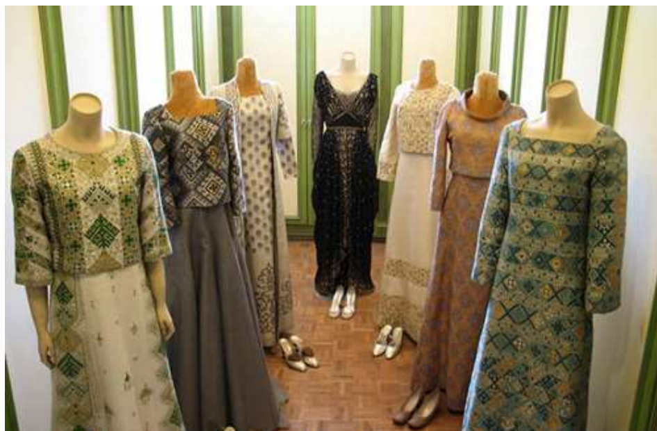
تصویر (۲) لباس‌های سلطنتی سوزن‌دوزی‌شدهٔ فرح پهلوی

موج سوم (سال‌های بعد از جنگ تحمیلی و دههٔ ۱۳۸۰ شمسی): موج سوم در ایران مصادف است با تشکیل معاونت صنایع دستی در سازمان میراث فرهنگی و گردشگری، در سال ۱۳۶۰ مرکز صنایع دستی طبق اساسنامهٔ جدید به صورت یک شرکت دولتی زیر نظر وزارت صنایع با عنوان سازمان صنایع دستی ایران قرار گرفت. در سال ۱۳۶۹ سازمان صنایع دستی فعالیت‌های خود را در قالب ده شرکت منطقه‌ای در سراسر کشور سامان‌دهی کرد و امور بازرگانی سازمان نیز به شرکت‌های مذکور محول شد. در سال ۱۳۷۶، حدود نُه شرکت منطقه‌ای منحل شد و یک شرکت به نام شرکت بازرگانی صنایع دستی تمامی فعالیت‌های بازرگانی و سازمانی را برعهده گرفت. در سال ۱۳۸۳ قانون تأسیس سازمان صنایع دستی ایران به تصویب مجلس شورای اسلامی رسید و نهایتاً پس از