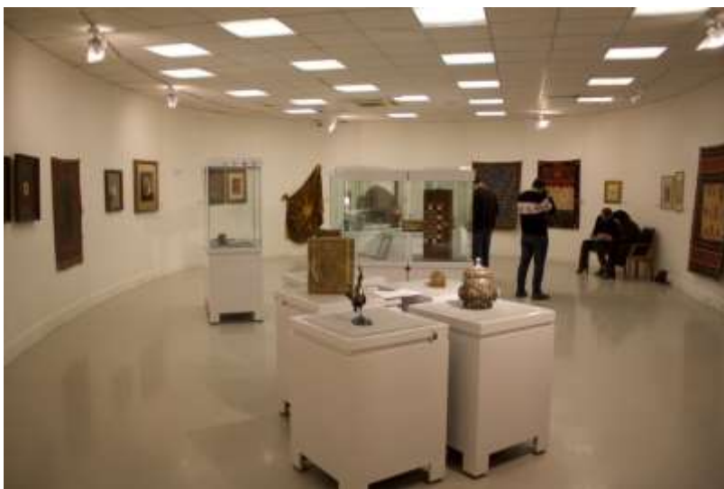
عکس (۱) جشنواره صنایع دستی و هنرهای سنتی فجر ۱۳۹۵: عکس مربوط است به سالن صنایع دستی سنتی

بنابراین آنچه تا بدین جا گفته شد تکه‌های پازل موج چهارم اقبال به صنایع دستی در ایران امروز را در قالب ظهور و موفقیت برندهای صنایع دستی مدرن در فضای مجازی نشان می‌دهد.