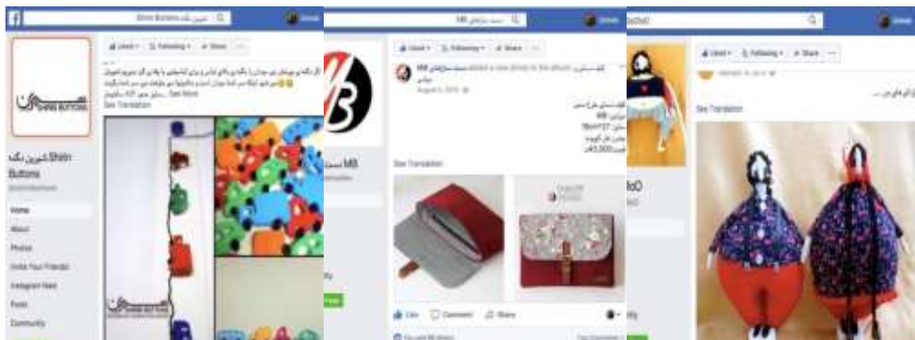
تصویر (۴) صفحات فیسبوک حلقه اولیه برندهای صنایع دستی

در اختیار داشتن محیط مجازی و امکانات شبکه اجتماعی فیسبوک به مثابه یک مکان بازار باعث دسترسی شبکه گسترده‌ای از افراد ظرف مدت کوتاهی به برندها و شناخته شدن آنها در بین مخاطبان شده است. هسته اصلی این برندها هم‌زمان با شرکت در جمع‌بازار پارکینگ پروانه تهران (و سایر جمع‌بازارهای هنری شهرهای دیگری مانند اصفهان و شیراز)، فروش حضوری و روابط اجتماعی رودرو با مخاطبان را تجربه کرده‌اند. با گذشت زمان، در پی مشکلات دسترسی به فیسبوک به دلیل فیلترینگ، این محیط مجازی که به مثابه