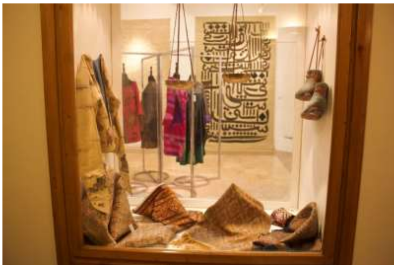
عکس (۲) جشنواره صنایع دستی و هنرهای سنتی فجر ۱۳۹۵: عکس مربوط است به سالن برندهای مدرن