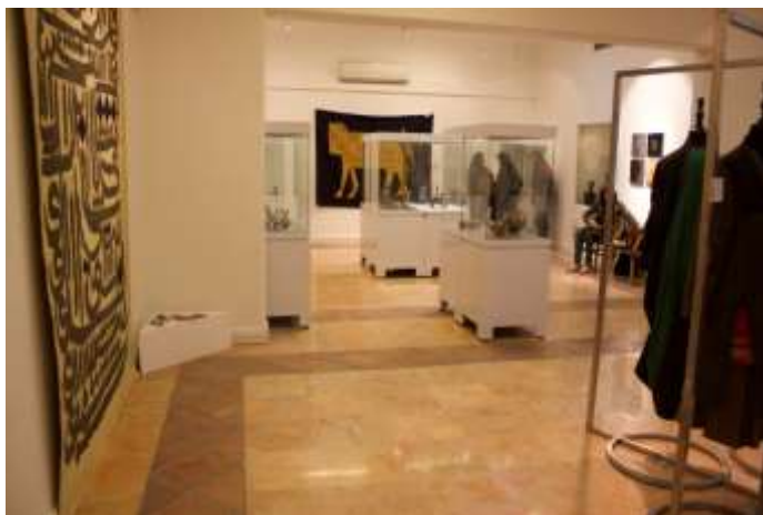
عکس (۳) جشنواره صنایع دستی و هنرهای سنتی فجر ۱۳۹۵: عکس مربوط است به سالن برندهای مدرن