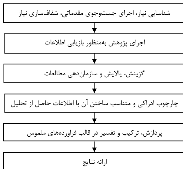
شکل ۱. مراحل سنتز پژوهی شش مرحله‌ای روبرتس (Roberst, 2008)

دکتری چاپ شده بین سال‌های ۱۳۸۰ تا ۱۳۹۸ در داخل کشور است که موضوع آنها تربیت جنسی، برنامه‌درسی تربیت جنسی و سلامت جنسی در دوره آموزشی است. برای اطمینان از نحوه کدگذاری‌ها از دو نفر ارزشیاب برای کدگذاری مجدد یافته‌ها استفاده شد که به منظور تأیید پایایی، از فرمول ضریب کاپای کوهن (coefficient Cohen's kappa) استفاده شد که در این پژوهش میزان توافق ارزشیابان عدد ۰/۷۸ به دست آمد