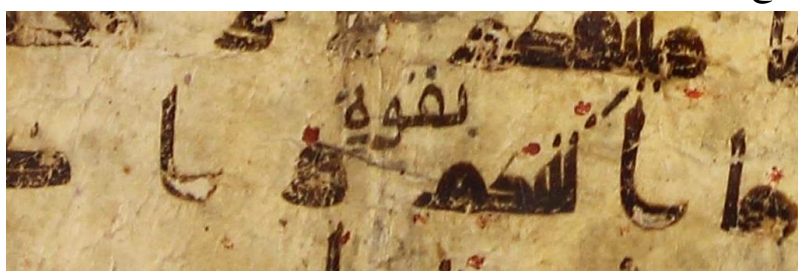
نسخه شماره ۱۸ آستان قدس رضوی

از معمول ترین خطاها در هنگام استنساخ نسخه از قلم افتادن بخشی از متن است. مواردی از این قبیل را فراوان می توان در نسخه ها مشاهده کرد. نمونه هایی از این افتادگی را در نسخه شماره ۱۸ محفوظ در کتابخانه آستان قدس رضوی می توان در افتادگی کلمه «قوما» در آل عمران ۸۶ و افتادگی کلمه «بقوة» در بقره ۶۳ مشاهده کرد که بعداً توسط کسی دیگر در بالای سطر اضافه شده است. چنین خطاهایی بازهم در نسخه های ادوار مختلف تاریخ بسیار شایع است.