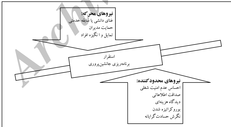
نمودار ۲. تحلیل میدان نیرو در برنامه‌ی جانشین‌پروری

در یک جمع‌بندی، می‌توان به دو سؤال اساسی تحقیق چنین پاسخ داد: در پاسخ به سؤال اول، به معرفی عوامل تسهیل‌کننده در برنامه‌ی جانشین‌پروری و در پاسخ به سؤال دوم، به معرفی عوامل بازدارنده‌ی برنامه‌ی جانشین‌پروری در شرکت ایتوک ایران پرداخته می‌شود.