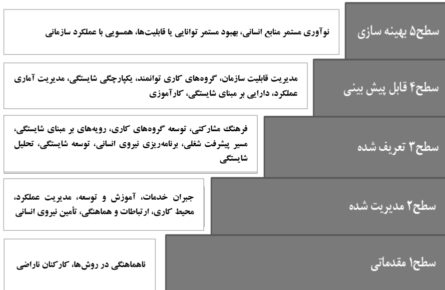
شکل ۱. مدل بلوغ قابلیت نیروی انسانی

سازمان را که در آن نیروی کار رشد می‌کند، بالاتر می‌برد. در چنین محیطی، افراد شانس بیشتری برای رشد توانایی حرفه‌ای پیدا می‌کنند و برای همسو کردن عملکرد خود با مقاصد سازمان، انگیزه بیشتری می‌یابند (کرتیس و همکاران، ۲۰۰۲: ۱۵).