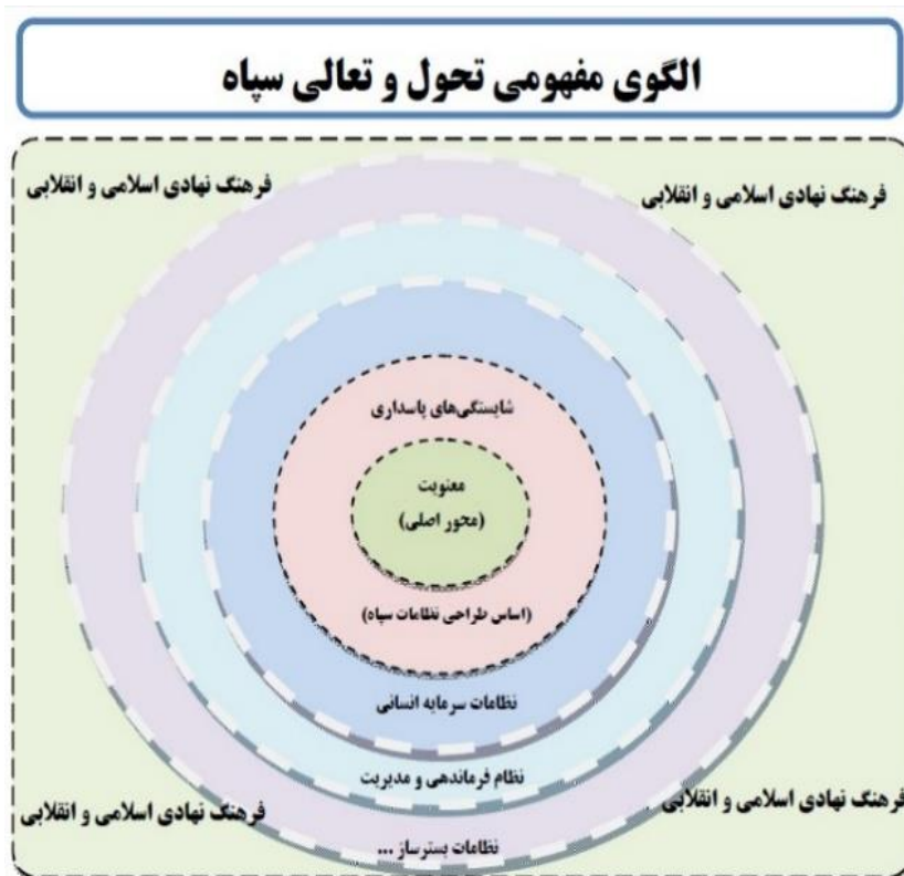
شکل ۱. الگوی مفهومی تحول و تعالی سپاه

به تعبیری می‌توان گفت شایسته‌سالاری مبتنی بر معنویت، زیربنای نظامات خواهد بود. این شایستگی‌ها و مدیریت بر آن نیز مبنایی برای ایجاد نظامات سرمایه انسانی است که در حلقه سوم مشاهده می‌شود. درحقیقت، سپاه در این الگو، به پاسداران و سایر انسان‌های مؤمن و شایسته خود به دید سرمایه و حتی اصلی‌ترین سرمایه می‌نگرد. حلقه چهارم، نظام فرماندهی و مدیریت است که در راستای انجام مأموریت‌ها، تأثیرات متقابلی بر سرمایه انسانی و سایر نظامات می‌گذارد. حلقه پنجم، سایر نظامات بستر ساز است که در حوزه‌های گوناگون تنظیم می‌شوند. این حلقه‌ها به هم