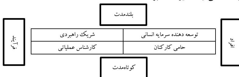
شکل ۱. نقش‌های منابع انسانی

دیدگاه منبع‌محور ۱ یک مدل عملکرد سازمان است که بر منابع و قابلیت‌های تحت کنترل سازمان به‌عنوان منشأ مزیت رقابتی تمرکز می‌کند. همچنین به‌واسطه ویژگی‌هایی که منابع انسانی دارند، می‌توانند به‌عنوان شایستگی محوری سازمان، مزیت رقابتی ایجاد کنند و سازمان به‌واسطه این منابع می‌تواند از سایر منابع سازمانی استفاده کند (بیرد و سامنر ۲ ، ۲۰۰۴: ۱۲۹ - ۱۳۳). لذا امروزه منابع انسانی به‌عنوان منبعی شناخته شده است که می‌تواند مزیت رقابتی ارزشمند برای سازمان باشد و شواهد متقاعدکننده‌چندی مبنی بر افزایش عملکرد بنگاه در صورت همسویی صحیح نظام‌های منابع انسانی و راهبرد کسب‌وکار وجود دارد (نو و هلنباک ۳ ، ۲۰۱۵: ۶۹). نقش‌های متخصصین منابع انسانی را می‌توان در دو بعد افراد و فرایندها خلاصه کرد. از این دیدگاه، متخصصان منابع انسانی به‌عنوان بخشی از نقش‌های خود، زمانی را صرف تعامل با هر یک از کارکنان می‌کنند. بخشی دیگر از زمان متخصصان منابع انسانی، صرف تدوین و بهبود فرایندهایی می‌شود که در استخدام و ایجاد انگیزه در کارکنان به کار گرفته می‌شود. از سوی دیگر، می‌توان این نقش‌ها را در دو بعد فعالیت‌های بلندمدت و کوتاه‌مدت تعریف کرد. براین اساس، از ترکیب این دو بعد، یک ماتریس چهارخانه‌ای به شکل نمودار زیر از نقش‌های متخصصان منابع انسانی به‌دست می‌آید (استیوارت و براون ۴ ، ۲۰۰۹: ۲۳۲).