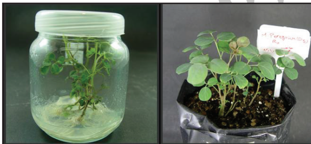
شکل ۳. رشد مطلوب گیاهچه‌های تولیدشده در محیط ریشه‌زایی و انتقال موفق گیاهچه‌های باززایی شده به خاک

** معنی‌دار بودن در سطح ۱ درصد؛ * معنی‌دار بودن در سطح ۵ درصد؛ ns: غیر معنی‌دار