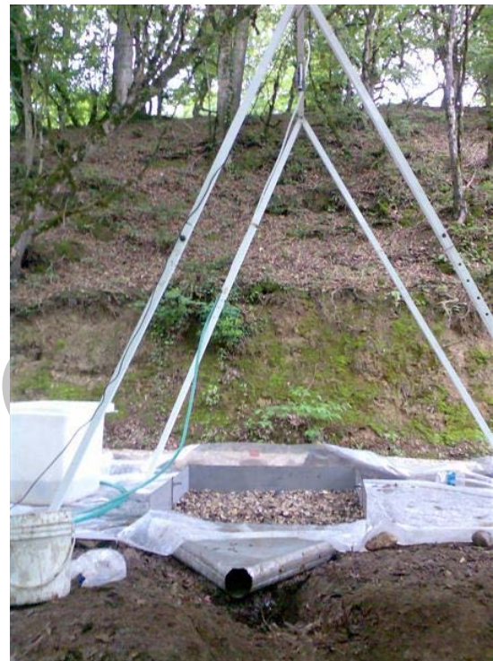
شکل ۲. استقرار باران‌ساز به‌همراه پلات فرسایشی در روی بستر جاده به‌منظور اندازه‌گیری مقدار رسوب و رواناب

من شماره ۴۲ و گذاشتن باقی‌مانده مواد روی کاغذ در دستگاه اون ۱ در دمای ۱۰۵ درجه سلسیوس [۱۷] به مدت ۲۴ ساعت و خشک و توزین کردن، وزن رسوب به‌دست آمد. ابتدا مقدار رسوب در هر کلاسه و سپس تغییرات آن به‌ازای تغییرات شیب بستر جاده محاسبه شد.