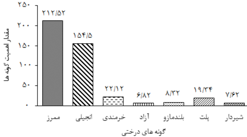
شکل ۱. مقادیر SIV گونه‌های درختی

برابر ۰/۲۱۳ به دست آمد؛ در حالی که اگر بر اساس مشخصه سطح مقطع مقادیر شاخص‌های یکنواختی اسمیت- ویلسون محاسبه شود، این مقدار برابر ۰/۱۲ است. اگر ملاک محاسبه شاخص‌های یکنواختی را حجم درختان انتخاب کنیم، این مقدار برای شاخص اسمیت- ویلسون برابر ۰/۱۰۴ است (شکل ۲).