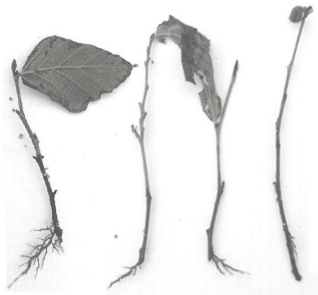
شکل ۲. قلمه‌های یکساله ریشه‌دار شده (به ترتیب از راست: تیمار شاهد، تیمار ۵۰۰، ۱۰۰۰ و ۲۰۰۰ میلی‌گرم در لیتر)

در لیتر تیمار شده بودند زودتر (میانگین مدت ریشه‌زایی ۳۰ روز) از بقیه قلمه‌های یکساله ریشه‌دار شدند. در قلمه‌های تیمار نشده میانگین مدت ریشه‌زایی ۴۰ روز بود.