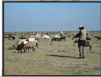
هفته اول آبان ۱۳۸۹