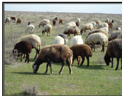
شکل ۷. نحوه برداشت علوفه توسط گوسفند نژاد دالاق در برداشت دوم (هفته آخر فروردین ۱۳۹۰)