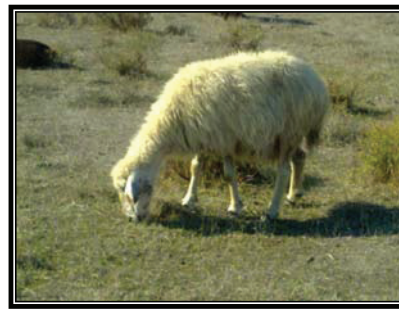
شکل ۶. نحوه تعلیف و گونه‌های برداشت‌شده توسط گوسفند نژاد دالاق (هفته اول آبان ۱۳۸۹)