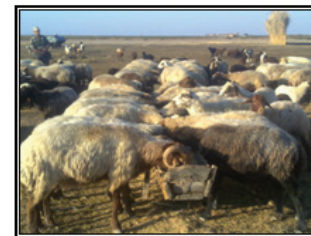
شکل ۴. نمایی از خوردن علوفه دستی (کاه خشک و جو) در آرام (آغل)