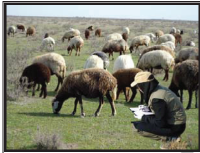
هفته آخر فروردین ۱۳۹۰

نخست با بازدید صحرایی محدوده چرای دام‌ها به وسعت ۵۰۰ هکتار با ظرفیت ۲۰۰ رأس واحد دامی - از نوع گوسفند ۱۸۰ رأس (نژاد دالاق) و بز ۲۰ رأس (نژاد مازندرانی) - مشخص شد. نژاد گوسفندی غالب دام‌های موجود در منطقه از نوع دالاق است که از لحاظ سنی به طور متوسط سه‌ساله بودند. وضعیت مرتع و ترکیب گیاهی با روش ارزش مرتع (Safaian & Shokri, 2003) و گرایش مرتع به کمک ترازوی گرایش تعیین شد. از آنجا که زمان برداشت نیز یکی از عوامل تأثیرگذار در نوع انتخاب رژیم غذایی