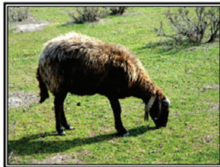
شکل ۲. مشاهده مستقیم شمارش لقمه در دو دوره برداشت