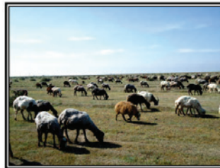
شکل ۳. نمایشی دیگر از مشاهده مستقیم تغلیف دام و محدوده چرای