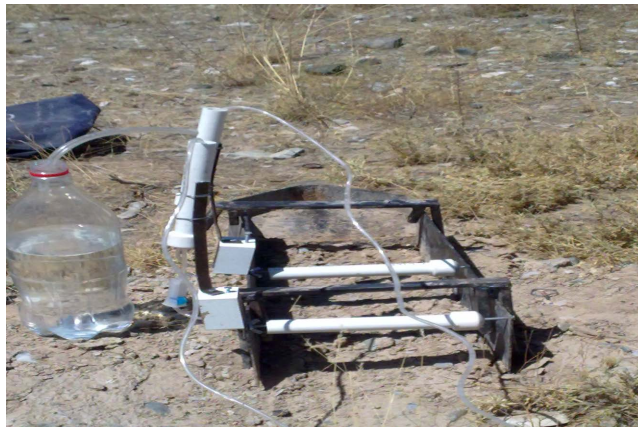
شکل ۱. وسیله طراحی شده جهت تولید رواناب

برای بررسی روند تغییر غلظت رسوبات جمع‌آوری شده، ظروف جمع‌آوری رواناب از ابتدای آزمایش تا انتها به ترتیب شماره‌گذاری شد. آب و رسوب جمع‌آوری شده به آزمایشگاه منتقل شد. سپس، وزن خشک رسوبات محاسبه گردید.