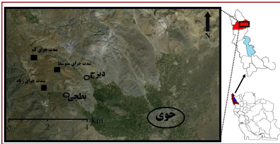
شکل ۱. موقعیت مکان‌های مورد بررسی در شهرستان خوی