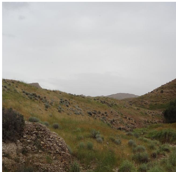
چشم‌انداز جنوبی مورد مطالعه