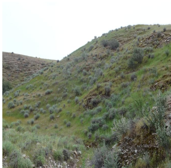
چشم‌انداز شمالی مورد مطالعه

شکل ۱. نمایی از چشم‌انداز شمالی و جنوبی دره کناری خشاب گچساران