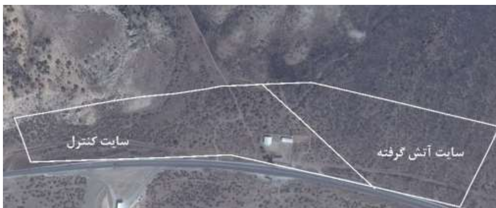
شکل ۱. موقعیت منطقه شارلق و نیز دو سایت آتش گرفته و کنترل

عدم سوختگی سطح خاک و در شدت زیاد آتش‌سوزی، سطح خاک تیره، دارای حدود یک سانتی‌متر خاکستر، سطح خاک سوخته و کمی قهوه‌ای رنگ و بقایای شاخه‌های سوخته بود (شکل ۲).