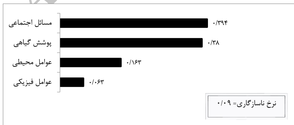
شکل ۳. وزن نسبی معیارهای مؤثر بر شایستگی زنبورداری در سه سامان مرتعی حوزه بالا طالقان

ابتدا جهت اطلاع از اینکه کدام معیار در ارزیابی شایستگی سه سامان عرفی حوزه بالا طالقان سهم بیشتری دارد، قضاوت متخصصین و کارشناسان که در