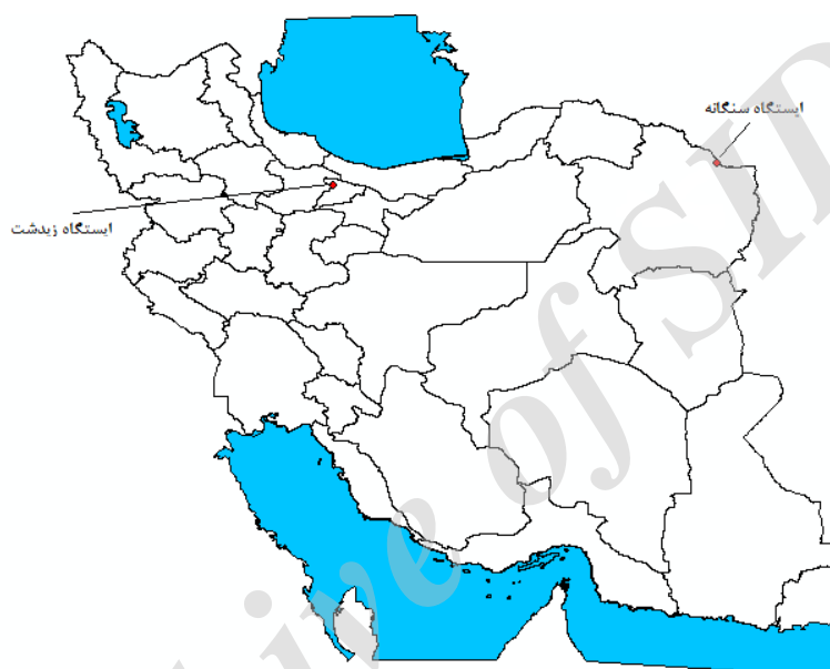
شکل ۱. سمت راست) موقعیت ایستگاه سنگانه (استان خراسان رضوی) و ایستگاه زیدشت (استان البرز) در کشور.

طالقان استان البرز به مختصات 40^{\circ} 50' طول شرقی و 36^{\circ} 12' عرض شمالی قرار داشته و ارتفاع آن از سطح دریا ۱۵۳۰ متر می‌باشد (شکل ۱). متوسط بارش (بارش مایع) سالانه این ایستگاه در حدود ۳۳۶ میلی‌متر می‌باشد. میانگین ماهانه بارش در طول دوره آماری ۲۰۱۳-۲۰۰۲ نیز در شکل ۲ نشان داده است. بر این اساس بیشترین مقدار بارش در منطقه در ماه آوریل